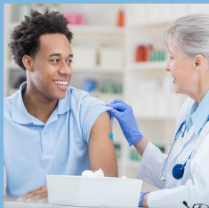
每年接種流感疫苗