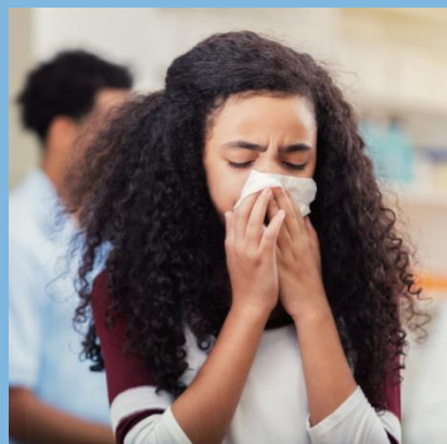
咳嗽時用手肘或紙巾 掩住口鼻